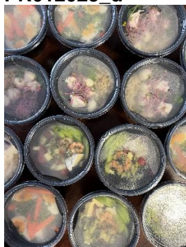
Akcja kulinarna w Hettich