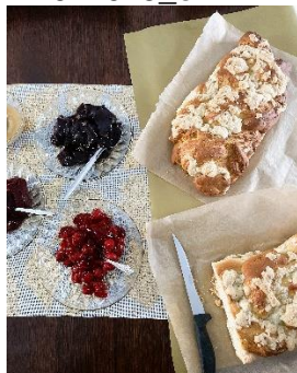
Akcja kulinarna w Hettich