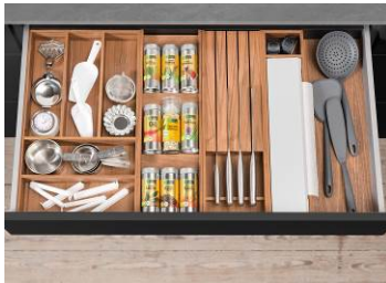
OrgaTray 230: il fascino naturale del legno massiccio sapientemente abbinato all'eleganza minimalista.