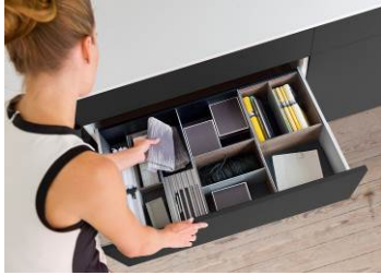
OrgaStore 260: l'esperienza estetica nell'ambiente domestico.