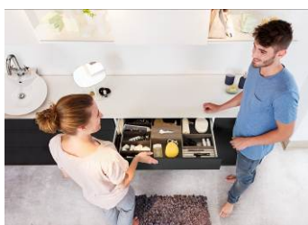
OrgaTray 260 : i piccoli oggetti del bagno trovano una chiara collocazione.

Le seguenti immagini sono disponibili per il download su www.hettich.com :