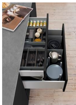
Con OrgaTray 260 e OrgaStore 260 la cucina è organizzata al meglio