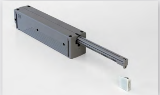
View of an eTouch motor unit and front sensor

The eTouch system is supplied with power directly from a power socket.